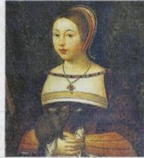
lina de Aragón. La batalla fue un desastre para Escocia que perdió

El último rey británico en morir en una guerra fue Jacobo IV que, a la cabeza del ejército escocés, atacó a los ingleses cerca de Flodden (1513). Al frente del ejército inglés no estaba el por entonces siete veces casadero rey Enrique VIII , sino nuestra paisana la reina Catalina de Aragón .