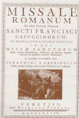
Missal Roma, Venècia (Itàlia) 1768. Nicolau Pezzana.

El primer volum és un "missal romà" en llatí dels típics utilitzats pels franciscans. De format foli major relligat en pell en prou bon estat de conservació. Presenta un gravat de Sant Francesc i va ésser editat en Venècia (Itàlia) en 1768 per Nicolau Pezzana, el qual va utilitzar el tipus Garamond