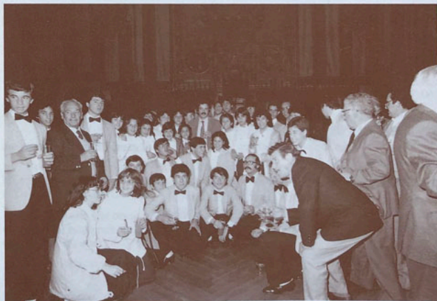
1983. Visita al Palacio del Ayuntamiento de Barcelona, con el Alcalde Pascual Maragall

Son diez actuaciones ofrecidas: Templo Parroquial, Albaterra; Centro Loyola, Alicante; jornada de convivencia en el día que Monóvar dedica a Fontilles; Fiestas en el Chinorlet y Monóvar; participación, junto con el Orfeón Dama de Elche, en el homenaje, en honor de Azorín, que realiza la Peña Madridista Ilicitana; Altea, Parroquia Nuestra Señora del Consuelo; VI Semana Musical de la Sociedad Santa Cecilia de Requena, consiguiendo un destacado éxito en un auditorio con más de mil personas.