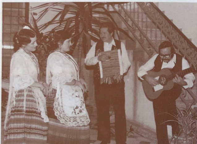
Refajo travesa; gracia y donaire; cañiset y guitarra. 1977. Grabación del disco "Danzas Alicantinas n.º 2"