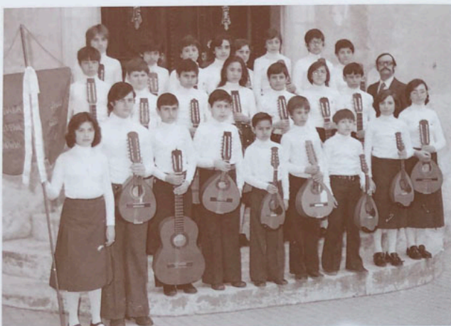
Primer Concierto de la Rondalla Juvenil