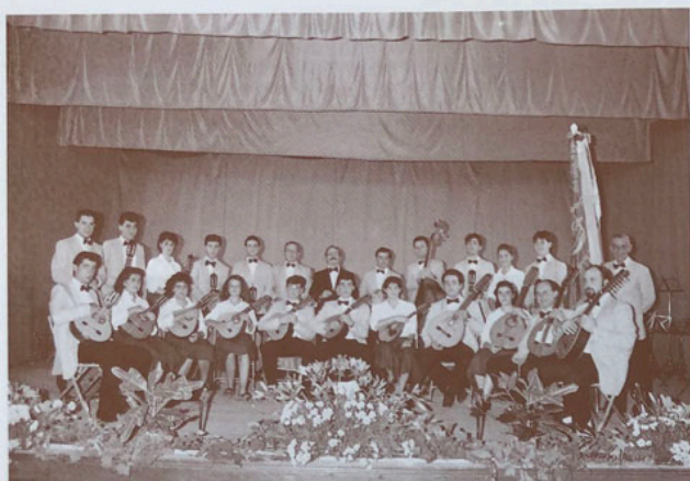
Septiembre 1990. Segunda etapa de la Rondalla