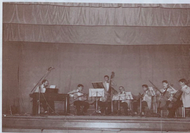
Sexteto de la Rondalla

Durante el año 1.987 se ofrecen cinco Conciertos: 3 en Monóvar y dos en Denia y Torreveija. Durante los otros años, hasta 1.991, queda semiparalizada, aunque mantiene su organización.