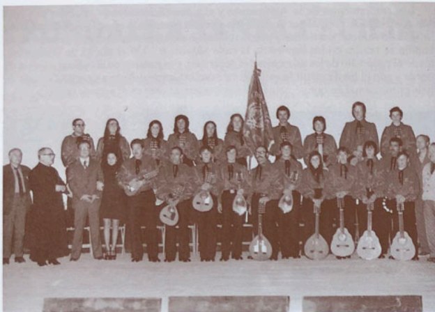
El primer Concierto. 1975