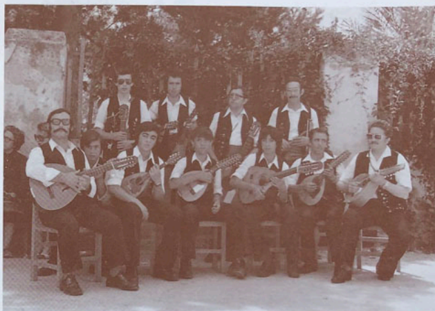
La Rondalla a espaldas del Casino

Los componentes de la Agrupación y algunos aficionados promueven una reunión con el fin de normalizar la situación y con la pretensión que el conjunto sea una Entidad de carácter particular y pueda realizar conciertos y actuaciones propias. Esta reunión se realiza en los locales de la calle Mayor, n.º 129 el día 15 de Diciembre, siendo el propósito de los asistentes “el desarrollo y expansión de la cultura musical de cuerda y con el fin de evitar la extinción de dicho Grupo debido a su actual estado de crisis proteccional en que se veía inmerso”, según se dice en el acta de la junta.