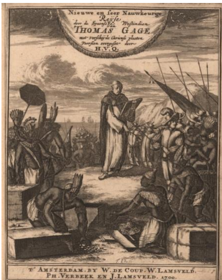
Portada de la edición holandesa de 1700