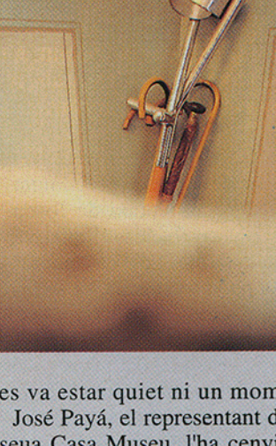
Un toc de cocqueteria ortopédica azoriniana.

«El tren mixto de Madrid salía de Valencia a las dos de la tarde. (...) Hice el viaje en tercera. No sé nada más». Valencia era una plaça morta als seus interessos. No va aconseguir de sentir-se còmode en cap dels dos fronts en què es debatia la ciutat. Blasco era «conservador, mujeriego, burgués». I els mèrits de Llorente no es corresponien amb «su proverbial engreimiento. Llorente se cree un Júpiter capitolino, y es un Ganímedes... de Silvela.» A Madrid busca col·laboracions en el diari El País amb la credencial del cartell que té a València, pero la relació amb el diari és interrompuda pel seu radicalisme. Azorín viu els seus dies de màxima agitació anarquista, impetu que el porta a les pàgines del setmanari El Motín , que, com la seua capçalera deixa entreveure, no posa-