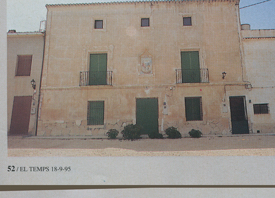
Collado de Salines, ara anomenat Collado de Azorín. Un enclavament estival molt referit en l'obra de Josep Martínez Ruiz.

dez de la Somera, empresonat per haver denunciat la protecció dispensada al joc. En aquest període Azorín és detingut per sospitats de voler atemptar contra la vida d'Antoni Maura, i quan Maura coneix la identitat del fals terrorista el crida i li presenta disculpes. I d'aquest moment neix una sòlida amistat entre el de Valldemossa i el de Monòver, amb un efecte polític immediat. Azorín és elegit diputat maurista en 1907 per Purchena (Almería). Arribat a aquest punt ja ha escrit La Voluntad, Las confesiones de un pequeño filósofo y El Político , llibre considerat com un manual de consulta per Benito Mussolini.