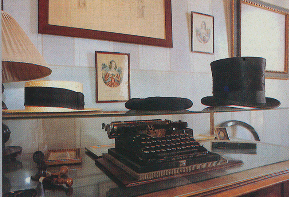
Sobre l'urna de la Underwood, tres fetitxes: la boina, el canotier i el copalta.