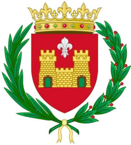
Escudo de Elda

obligada en almuerzos y fiestas populares, el cocido con pelotas por Navidad y el "mesclaco" a base de vermut, Picón, sifón y aceitunas para la traca y aperitivo del 8 y 9 de setiembre.